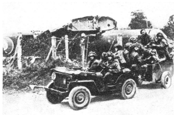
Aus einer «Horsa»: 1 Jeep, 1 Anhänger, 8 Mann Luftlandetruppen.