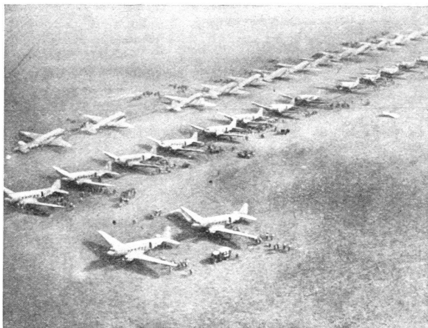
Fallschirmtruppen gehen an Bord der «Dakotas» (DC-3).