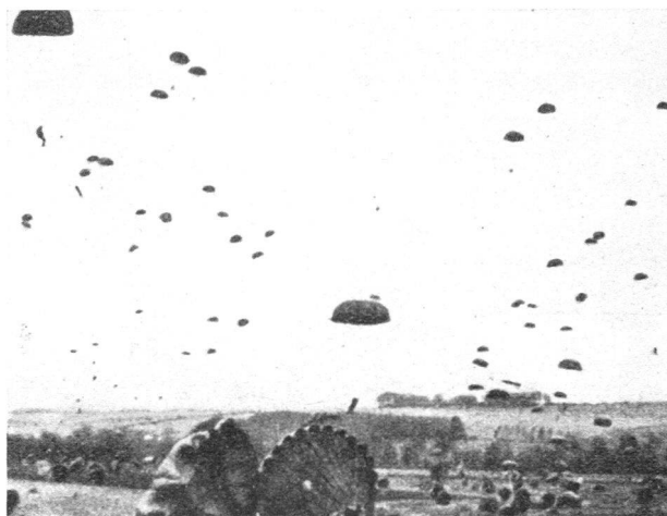
Fallschirmtruppen werden abgesetzt.

Während Fallschirmtruppen fast überall abgesetzt werden können, trifft dies für Luftlandetruppen nicht zu. Die Landung der Flugzeuge ist an ebenes, hindernisfreies Gelände gebunden.