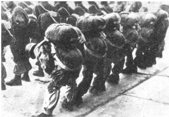
Fallschirmtruppen machen sich bereit.

Einzelaktion zu Spionage- und Sabotagezwecken.