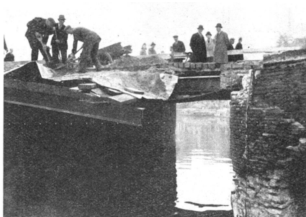
Abb. 5. Kreisvorsteher und Mannschaften arbeiten in Zivil.

der Luftschutzorganisation erfolgte in der Regel durch den Luftschutzführer selbst oder durch dessen Stellvertreter, währenddem die Führer der Hilfsdienste die Dislokationsbefehle ergehen liessen. Die unmittelbare Leitung der Aktion an Ort und Stelle hatten die Revierleiter, also die Polizei-offiziere. Für die technische Leitung und Oberaufsicht der Arbeiten standen ihnen die Kreisvorsteher zur Verfügung (Abb. 5). Letztere hatten