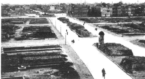
Abb. 1. Das zerstörte Zentrum von Rotterdam. Die noch brauchbaren Bausteine sind in der Strassenmitte aufgeschichtet.