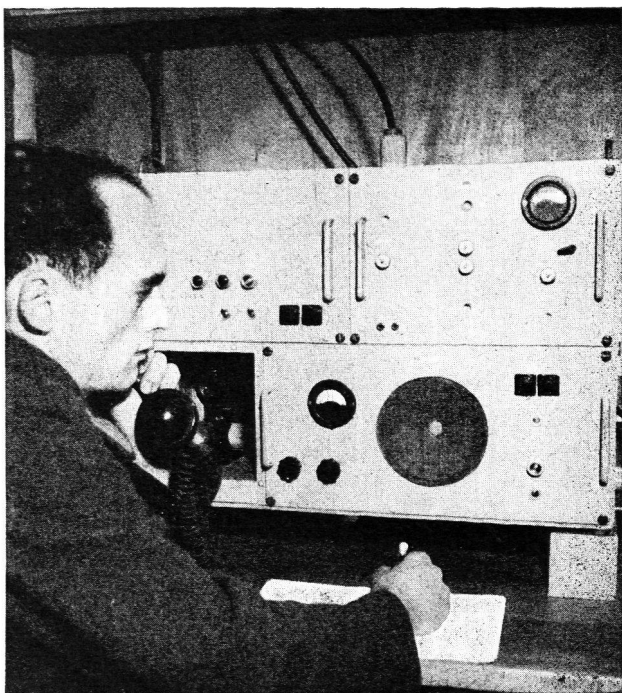
Abb. 1 UKW-Gerät (Leitstation)

würden. Da deshalb direkt im Klartext gesendet werden kann, werden Fehlerquellen und Verzögerungen durch Chiffrieren vermieden.