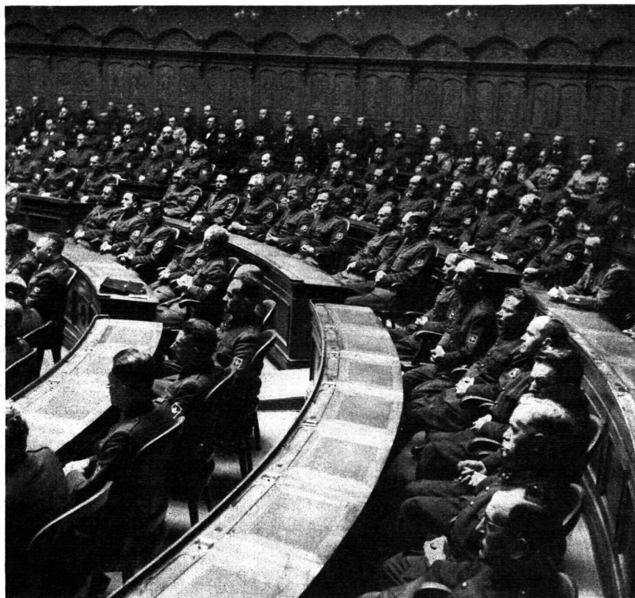
Zensur-No. III 8938 Ae

Einige hundert Luftschutzoffiziere der ganzen Schweiz haben sich vorangehend der Gründungsversammlung zu einem Rapport im Nationalratssaal eingefunden, um Ansprachen von den Herren Bundesrat Kobelt und Prof. v. Waldkirch anzuhören.