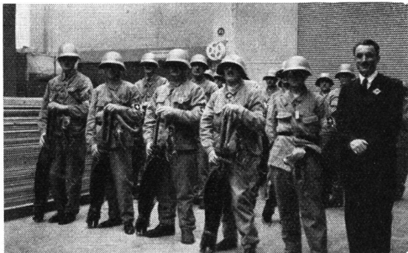
Groupe de D. A. P. de Lausanne.

La ville de Lausanne a organisé au milieu du mois d'avril ses deux premiers exercices d'obscurcissement, qui n'ont pas manqué d'apporter d'intéressantes constatations. En tout premier lieu, il faut signaler la bonne volonté que la population a manifestée à l'endroit de ces expériences nouvelles. Dans les quartiers du nord-ouest et de l'ouest de la ville, tour à tour, l'obscurcissement fut assez bien réalisé de 20 h. à 22 h. En effet, dans presque toutes les maisons, on a rencontré un réel intérêt de la