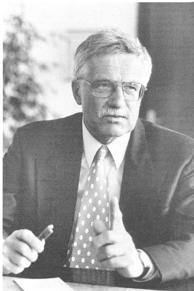
Der tschechische Ministerpräsident Václav Klaus

Gemäss meiner prinzipiellen ideologischen Überzeugung bestreite ich nicht, dass das Individuum — und nicht irgendeine Institution über diesem — die Basis jeder demokratischen Gesellschaft (und die ist als solche positiv zu bewerten) bildet. Das entscheidende Kriterium zur Beurteilung aller möglichen Arten und Formen menschlicher Institutionen oder Organisationen (Kollektive) ist deshalb deren positiver oder negativer Beitrag zur Maximierung individuellen Glücks oder jeder anderen Alternative dazu, nicht umgekehrt. Das Individuum hat eine primäre