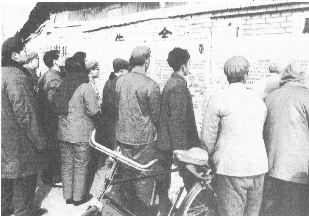
Wandzeitungen als Vorboten politischer Reformen

So geschickt Gorbatschow auf dem ausserpolitischen Parkett operierte, so glücklos war er zu Hause in seinem Bemühen, den angekündigten politischen und wirtschaftlichen Systemwechsel herbeizuführen. Bei der Gestaltung seiner Strategie und Taktik machte er zwei folgenschwere Denkfehler, die er offensichtlich erst spät begriff, als alles kaum noch zu korrigieren war: