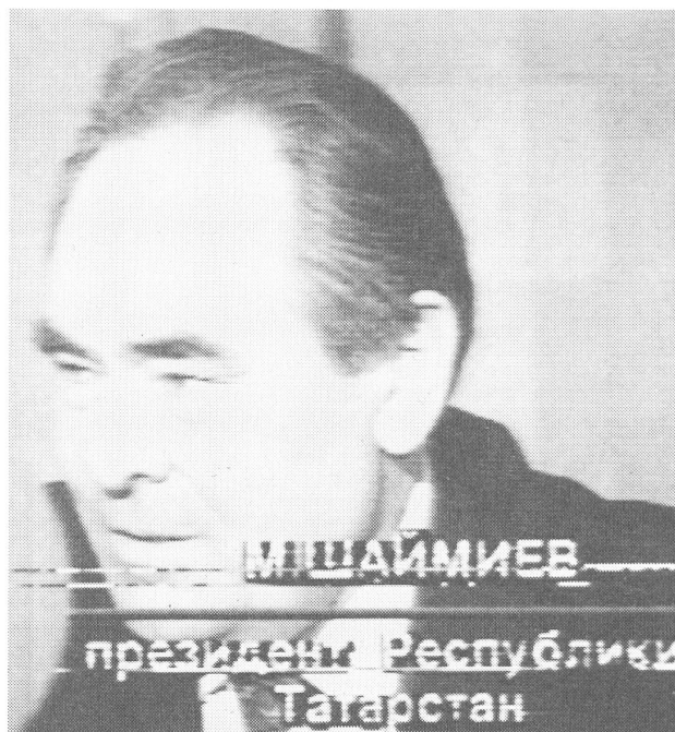
Präsident Mintimer Schamijew (TV Moskau, 15. 4. 1994).

Tatarstan ist eine industriell und landwirtschaftlich gut entwickelte Region. Von besonderer Bedeutung ist der Indu-