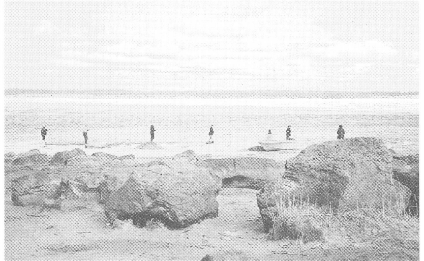
Fischer am Amur.

Die Befreiung von längst unglaublich gewordenem Lehrstoff und der Umbau des sowjetischen Schulsystems bedeuten für die Lehrenden eine Aufgabe, der man sich mit grossem Engagement widmet.