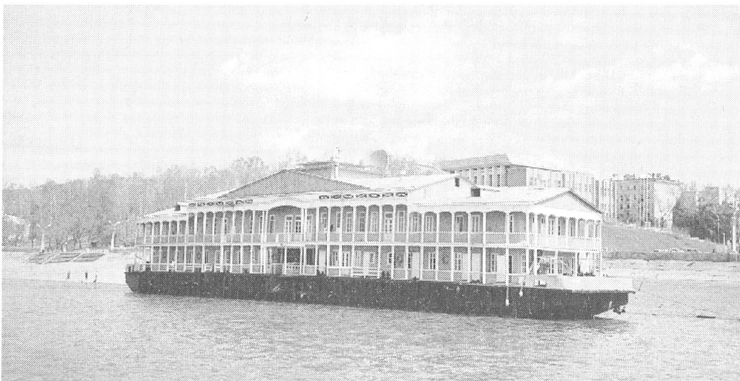
Schwimmendes Hotel auf dem Amur.

Seit der Öffnung des Landes reisen immer mehr ausländische Jäger, vor allem aus Japan, Amerika oder Deutschland hierher, um gegen eine Abschussgebühr, natürlich in harter Währung, einen Bären zu schießen. Im Moment lässt sich damit ganz gut verdienen, von den einheimischen Jägern bis zu den Intourist-Übersetzern profitieren alle davon, doch auf die Länge wird so wohl dem Land ein Bärendienst erwiesen. Aber nicht nur den Bären vergeht das Lachen: