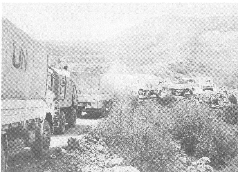
Auf der UNO-Piste zwischen Tomilsavgrad und Prozor.

Kein Rappen ging bisher an administrativen Aufwand. Selbstverständlich arbeiten alle Helfer ehrenamtlich. Die Gruppe hat kein Büro, keine Lagerkosten, keine Statuten und Vorschriften; sie lebt allein vom guten Willen der Initianten und Spender.