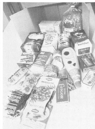
Das «grosse» Paket.

Noch waren es im April 1992 keine Lastenzüge, nur drei Privatwagen, die über Rijeka, die Insel Pag, Split und Metkovic ins umkämpfte Tal gelangten.