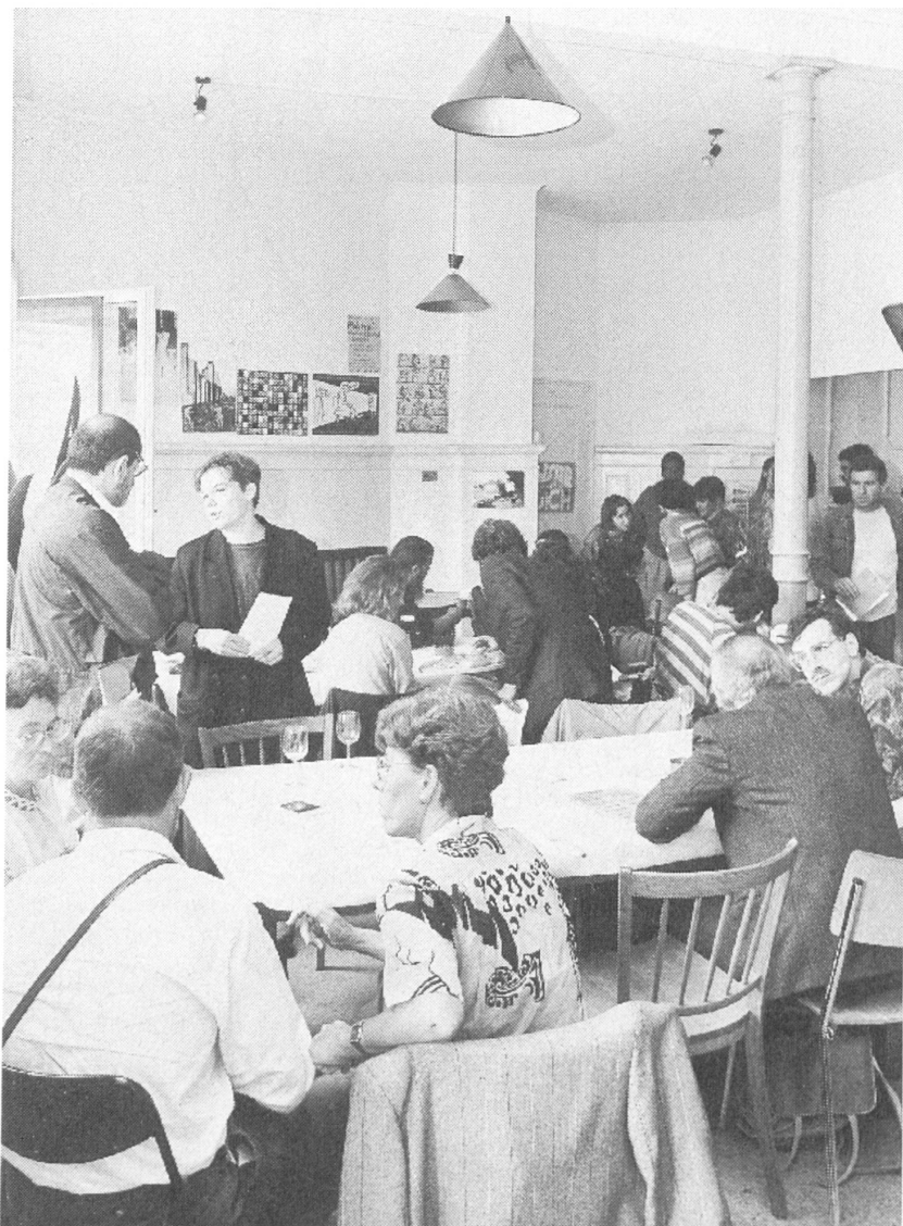
Arbeitslose in Zürich bei einem Treff (Foto: Keystone).

das «Arbeitslosenprojekt» des Schweiz. Ost-Instituts (SOI) berichtet haben, meldeten sich innert kürzester Zeit über achtzig Interessenten bei uns. Weitaus der grösste Teil von ihnen sind Männer (nur etwas mehr als zehn Frauen), meistens aus der Deutschschweiz. Insgesamt sind über zwanzig Interessenten osteuropäische Emigranten, die seit Jahren in der Schweiz leben.