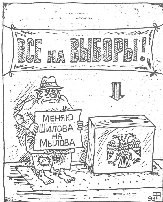
«Alle an die Wahlurnen.» «Tausche Hans gegen Heiri.» (Aus der «Iswestija», 2. 12. 1993.)

Wir werden später auf den Inhalt der Verfassung noch zurückkommen, weil sie mit Sicherheit zum Hauptangriffspunkt (Kritik, Korrekturvorschläge) der Opposition im Parlament werden wird. Jetzt nur so viel: Mit der neuen Verfassung können Präsident und Regierung ihren Reformkurs nicht sicher, aber etwas leichter fortsetzen. Die Dekrete des Präsidenten können nicht einfach blockiert werden, und somit ist eine Stabilisierung der Lage möglich.