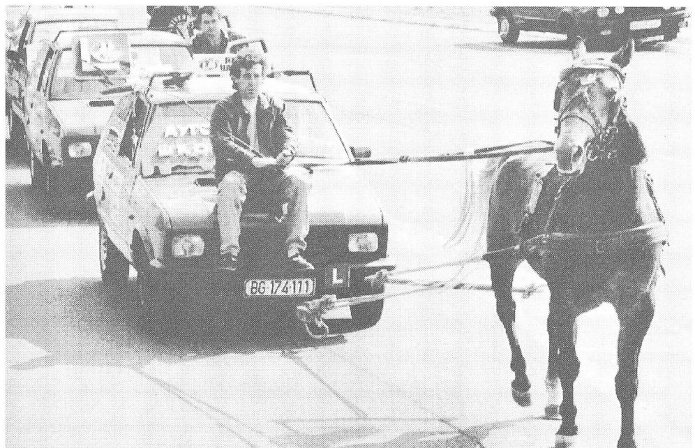
Wer sich Benzin nicht mehr leisten kann, behilft sich anders – mit einem PS.

Dass dabei auch Druck auf die Bevölkerung ausgeübt wird, kann man den Ausführungen des Kosovo-Politikers Shkëlzen Malliqi entnehmen, wonach die Albaner, sollten sie sich an der Wahl beteiligen, die Sozialisten zu Fall bringen würden. Das wurde prompt von den Medien im Kosovo dahingehend interpretiert, dass er gerade damit die Albaner zur Teilnahme an den Wahlen aufgerufen habe. Demgegenüber meinte