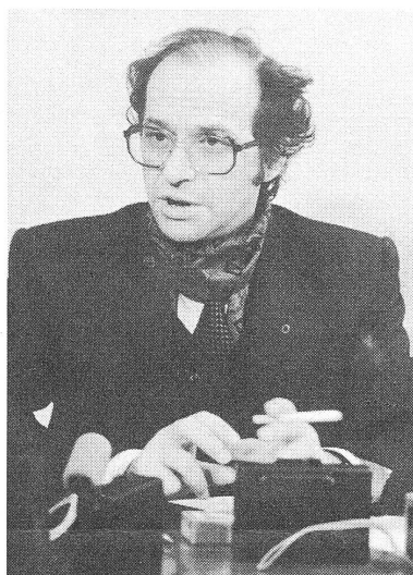
Staatspräsident der «Schattenregierung»: Ibrahim Rugova.

Einen Verdacht in diese Richtung äusserte denn auch der albanische Verteidigungsminister Safet Zhulali, als er nach