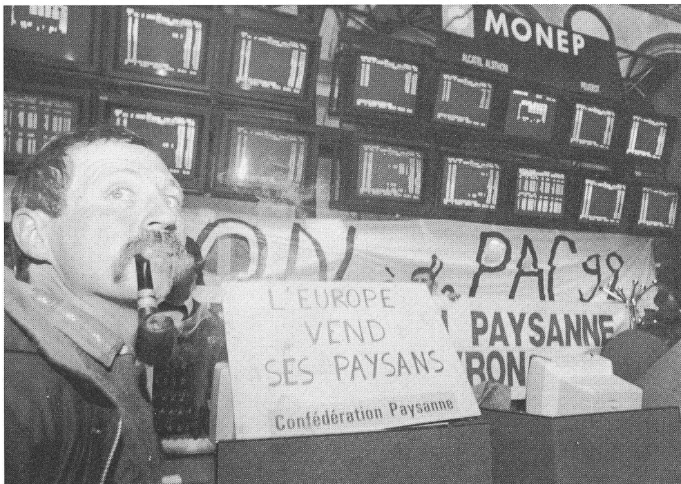
Europas Bauern: von Europa verkauft und verraten?

EG am liebsten nur einen funktionierenden Binnenmarkt als vorläufige Endstufe der wirtschaftlichen Integration sehen, plädieren die anderen dafür, vor dem nächsten Schritt — nämlich der Einführung einer Wirtschafts- und Währungsunion — zunächst die Europäische Politische Union zu verwirklichen, ganz nach dem einleuchtenden Motto: Zuerst ein gemeinsamer Staat, dann erst eine gemeinsame Währung.