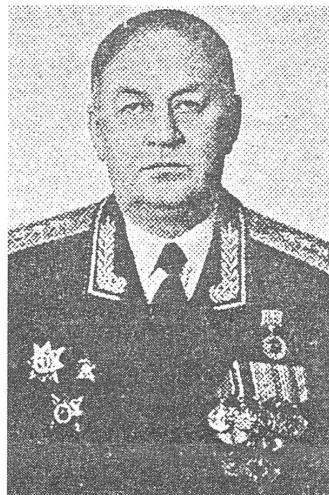
Generaloberst Michail Kolesnikow.

Sehr ausführlich und überzeugend argumentierte der neue Generalstabschef Russlands, Generaloberst Michail Kolesnikow (vgl. auch S. 16 dieser Ausgabe; Red.), vor Dozenten und Hörern der Akademie des Generalstabs zugunsten des Abrüstungsvertrags: «Bei der starken Kürzung der strategischen Angriffswaffen um etwa 2/3 gegenüber den gegenwärtigen Beständen ist es wichtig, sich nicht von Emotionen und raschen Schlussfolgerungen über unsere angeblich unbegründeten Konzessionen an die USA leiten zu lassen, sondern von nüchternen genauen Kenntnissen auf dem Gebiet der Nuklearwaffen als Ergebnis mehrfach durchgeführter Berechnungen und Prognosen.»