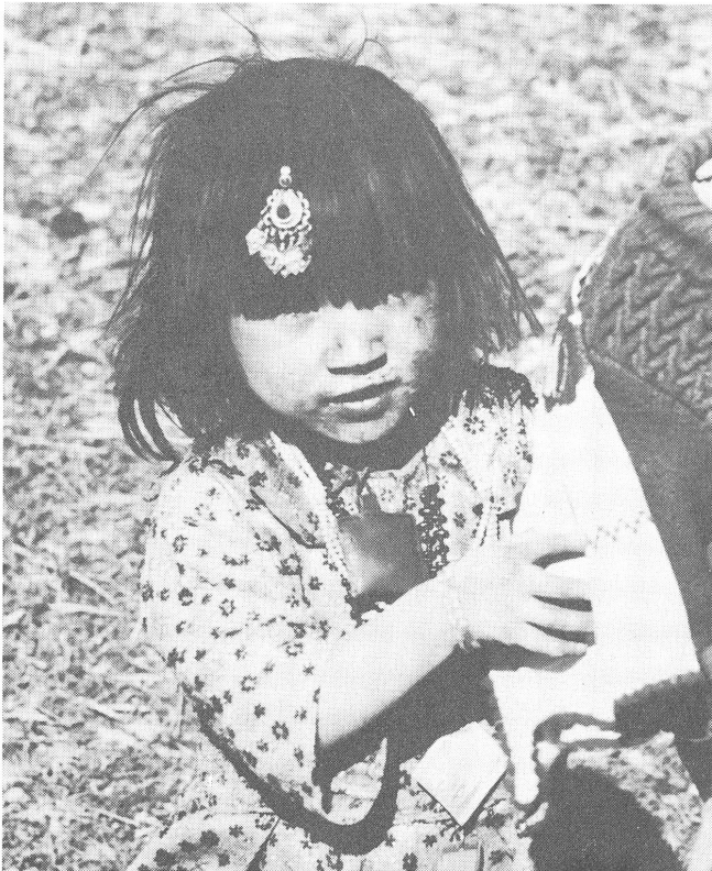
Ein afghanisches Mädchen mit traditionellem Schmuck.