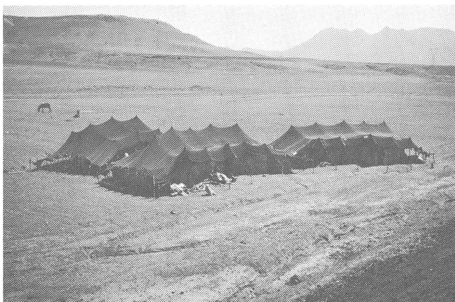
Kurdische Nomadenzelte beim Van-See.

Wir hatten Gelegenheit, in einem Grenzdorf mit jungen Kurden zu diskutieren. Sie erklärten uns, dass sie nichts zu fürchten hätten, solange sie sich an die Gesetze des Landes hielten. Man lasse sie in Ruhe, und alle hätten Arbeit. Eine Ausnahme? Wahrscheinlich nicht, aber eben: «Es kann der Frömmste nicht in Frieden leben, wenn es dem bösen Nachbarn nicht gefällt.» Hoffentlich finden die kriegsgeschüttelten, «missbrauchten» Kurden doch eines nicht allzu fernem Tages ihren Frieden. (St.Sch.)