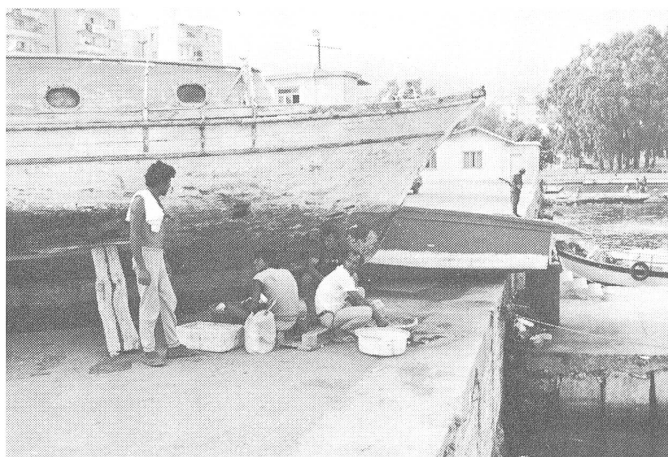
Das Boot als Symbol für die Freiheit im Westen: Der Lack ist ab, und leck ist es auch. (Fotos: Rebecca Dimoulitsas).

Unser Gefährt kam noch erstaunlich auf Touren, als wir durch die normalen Quartiere von Saranda fuhren, die armen. Den Teil an der Bucht habe ich schon beschrieben, und er