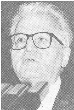
Staatspräsident Dobrosav Cosic: geistiger Vater von Kommunistenführer Milosevic.

Das geschah damals in Opposition zur KP, aber dann rettete sich diese, zur Sozialistischen Partei geworden, ihrerseits ins Serbentum, und als dessen Vorkämpfer profilierte sich bald Slobodan Milosevic, Serbiens Präsident. Man hörte praktisch nur noch ihn, und die Losung «Alle Serben in einem Staat» gilt heute direkt als Wahrzeichen seiner Politik. Indessen war der Satz schon längst die Parole von Cosic und seinem Kreis gewesen. Er ist in diesem Punkt der geistige Vater von Milosevic.