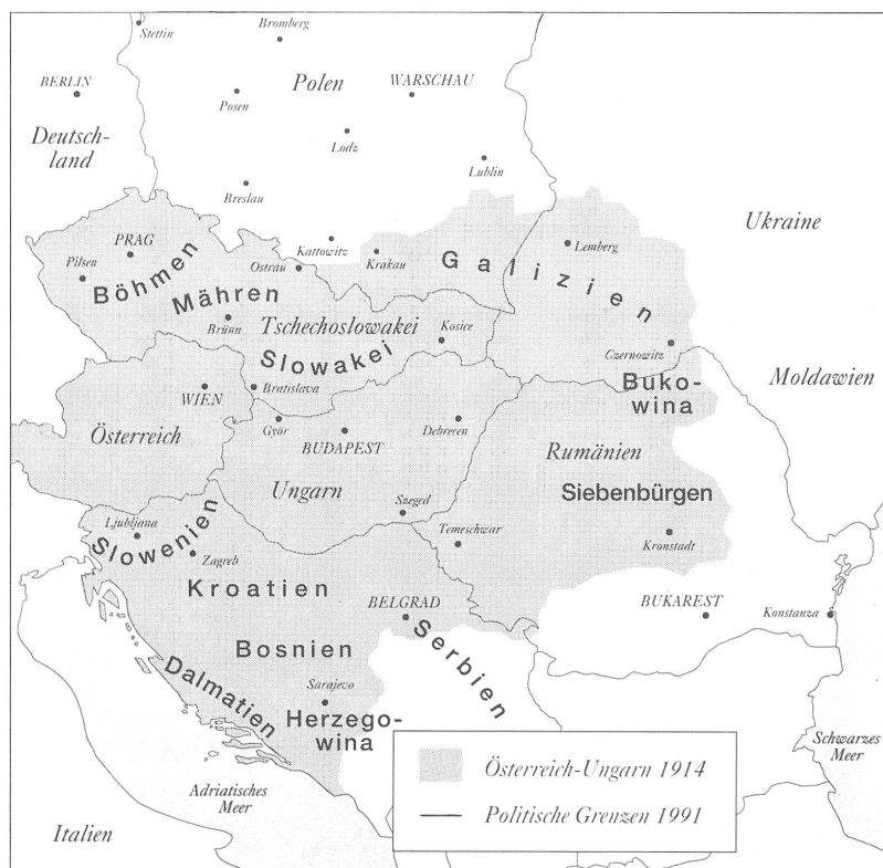
Historisches Erbe: Die Nationen, Völker und Minderheiten der alten österreich-ungarischen Monarchie drängen zu Selbstbestimmung und Unabhängigkeit. (Quelle: «Kaisergelb oder Die Heimkehr nach Europa», Hrg. Bank J. Vontobel & Co. AG)

Ein neues Modell für die Befriedung dieser Gegend haben sowohl Paris wie auch London nicht. Wieder neue künstliche Staatengruppen zu bilden, wäre unerwünscht und schädlich. Als einzige Lösung in dieser Phase bietet es sich an, allen Völkern unter Fremdherrschaft im Donau-Raum das Selbstbestimmungsrecht zu garantieren und die Serben und andere daran zu hindern, diesen Weg militärisch zu blockieren. Wirtschaftliche Zwänge werden freilich die neuen und alten Staaten in diesem Raum zur politischen Neuorientierung zwingen. Hier gibt es aber nur eine Einbahnstrasse. Und die führt nach Westeuropa, nach Brüssel. Zurzeit ist nur die EG imstande, diesen Ländern wirtschaftlich unter den Arm zu greifen. Russland, das schon unter den Zaren grosses Interesse an der Ausdehnung seiner Macht auf den Balkan zeigte, ist glücklicherweise zurzeit mit sich beschäftigt und hat keine Mittel, eine politische Werbekampagne im Donau-Raum zu veranstalten. Dies kann sich aber schnell ändern, wenn in Moskau die Machtfrage so oder anders geklärt ist. Daher wäre es ratsam, diese Zeit nicht abzuwarten, sondern gegenüber Belgrad energisch aufzutreten, bevor ein grosser Balkan-Krieg ausbricht. Diese Aufgabe können nur die besten diplomatischen Köpfe der EG und der UNO leisten – leider ist gegenwärtig nur das «zweite Aufgebot» im Einsatz.