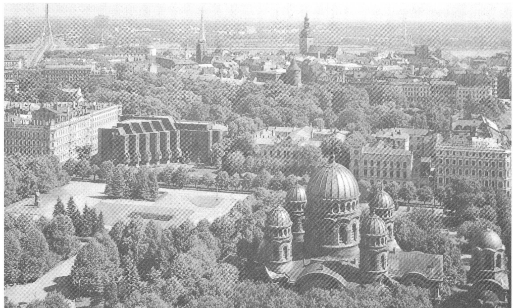
Gesamtansicht des Stadtzentrums von Riga. Im Hintergrund die Duna mit der modernen Hängebrücke (rechts in oberer Bildecke).

den früheren Zeiten unter dem kommunistischen Regime zurücksehnt. Dem ist aber offensichtlich nicht so. Der Kommunismus als utopische Heilslehre hat in Lettland so endgültig abgewirtschaftet, dass den Lehren von Marx und Lenin nur noch wenige unbelehrbare Dogmatiker und Fanatiker auf den Leim kriechen. Bezeichnenderweise ist das wuchtige Lenin-Denkmal in Riga, mit eingeschlossen der Sockel mit Inschrift, abgetragen worden, und auch in allen anderen Städten und Ortschaften Lettlands ist Lenin als obligater «steinerne Gast» ebenso wie alle bombastischen Slogans und Symbole in der Versenkung verschwunden. An Lenins Geburtstag haben in Riga am Standort seines ehemaligen Monuments nur einige hundert Alt-Kommunisten rote Blumen niedergelegt und eine Art Ehrenwache gehalten. Einige Tage später aber zogen viele Tausende von Gläubigen der orthodoxen Kirche mit Fahnen von Lettland, Russland, Weissrussland, der Ukraine usw. mit Sprechchören und Heilsrufen an dieser gleichen Stelle vorbei, um das orthodoxe