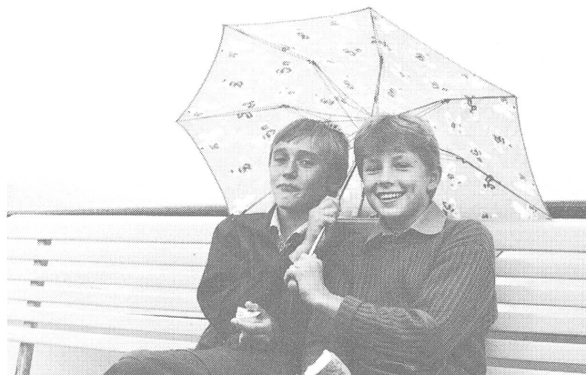
Trotz Regen Ausflug auf dem Thunersee.

Zugleich machten die Stadtpräsidentin und die Schulvorsteherin von Dobrusch in Ittigen einen Gegenbesuch, wodurch bekannt wurde, welche Auswirkungen der Atomunfall für Dobrusch hat und in welcher wirtschaftlich schwieriger Versorgungslage die Gemeinde ist.