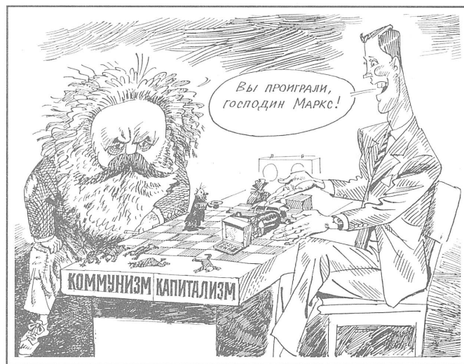
«Ihr habt verloren, Herr Marx.»

Die sozialistische Begriffswelt hat Trümmerhaufen von unterschiedlichem Zweitgebrauchswert hinterlassen, aber das schiere semantische Chaos dominiert, und besser als ein zusammenhängendes System ideologischer Lügen ist dieser Zustand allemal. In ganz konkreten Belangen indessen hat uns der Sturz der Ereignisse endlich gelehrt, vorhandene Begriffe richtig zu gebrauchen. Wir haben aufgehört, «Russen» zu sagen, wenn wir Georgier oder Kasachen meinen, und bezüglich der Mazedo-