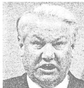
B. Jelzin, Russland