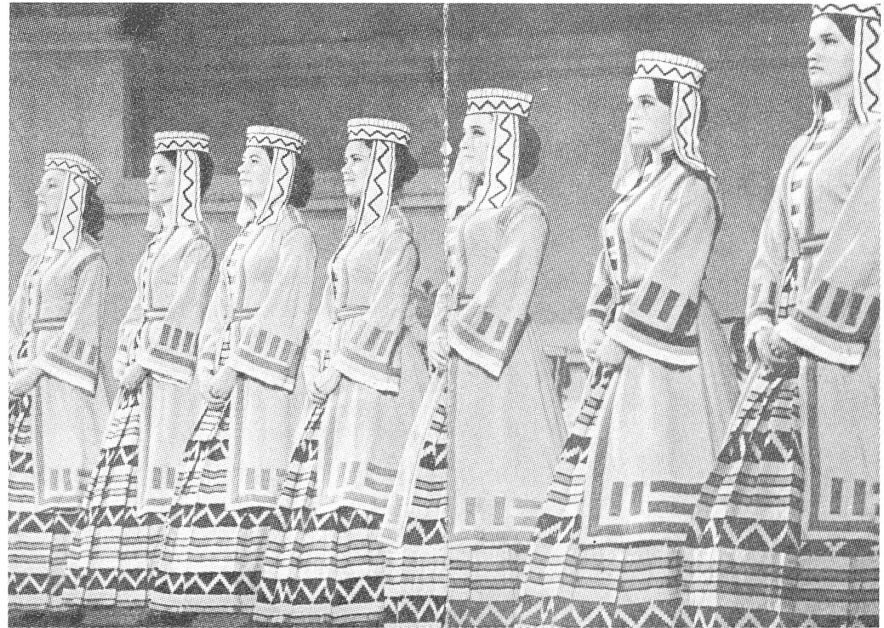
Gesang- und Tanzensemble «Lietuva» (Litauen).

Allen drei baltischen Staaten gemeinsam ist ihre schon vor längerer Zeit deklarierte und früher als in anderen ehemaligen Sowjetrepubliken durchgesetzte Selbständigkeit und Unabhängigkeit. Manche westliche Stimme, die namentlich den Litauern als den Vorreitern des baltischen Befreiungsprozesses ihr Vorpellen und das Stören des Reformprozesses Gorbatschows zum Vorwurf machten, erweist sich jetzt als unrichtig. Denn erstens zeigt die Gesamtentwicklung in der früheren Sowjetunion (die Sezessionsbestrebungen aller Republiken und deren Verzicht auf ein Unionszentrum), dass das litauische Drängen nur natürlich und berechtigt war, und zweitens zeigen die ausserordentlichen