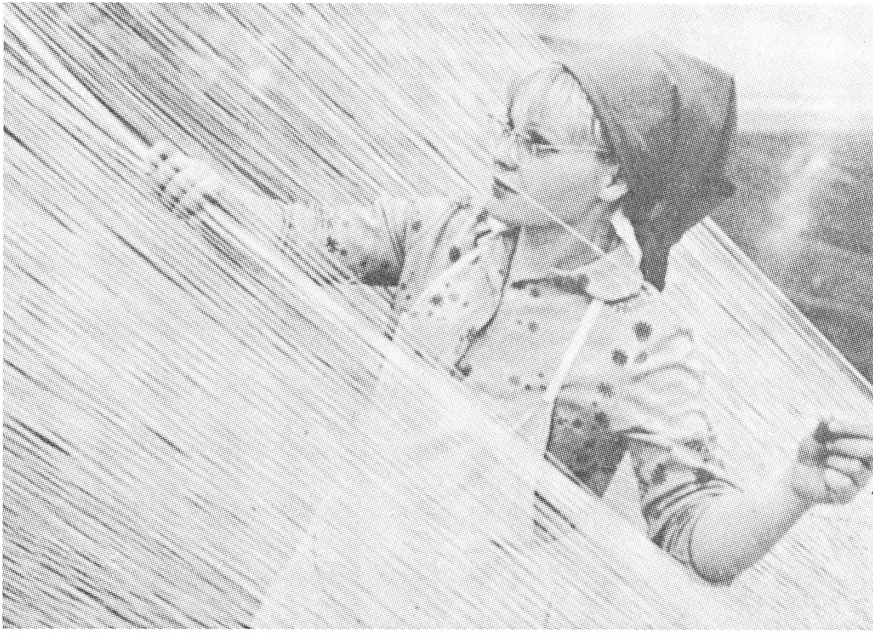
In der Kunstfaserfabrik Dangav-Pils (Lettland).

Wirtschaftsschwierigkeiten in allen Republiken, dass auch der Zeitpunkt der Sezession der baltischen Länder richtig gewählt war. Sie werden jetzt viel weniger als andere in den wirtschaftlichen Abgrund der zerfallenden Union hineingezogen. Sicherlich haben die baltischen Länder noch Probleme zu lösen: Lettland mit seinem Drittel der russischen Bevölkerung, Litauen mit seiner polnischen Minderheit usw. Und doch sind sie dank des frühzeitigen Austritts aus der Union von den zahlreichen (militärpolitischen, wirtschaftlichen, nationalen, aussenpolitischen und parteinomenklaturbedingten) Problemen der anderen Republiken weitgehend verschont geblieben. Aus dem gleichen Grund (frühzeitiger Austritt) macht auch ihr politischer und wirtschaftlicher Anschluss an den Westen gute Fortschritte.