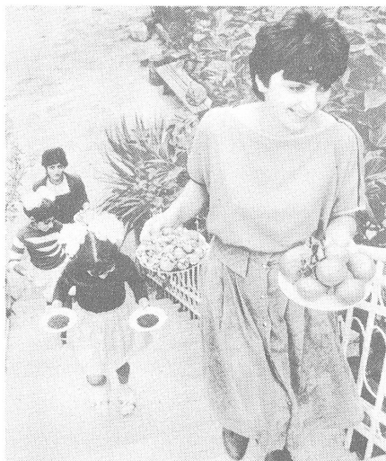
... und Familie (beide Bilder aus: «Sowjetunion heute», November 1988).