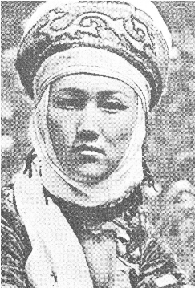
Eine Kirgisin in traditioneller Tracht.

In Kirgisien befürchtet man eine Verschlechterung der Beziehungen zur benachbarten Grossmacht China, weil Peking im Zusammenhang mit der Verselbständigung der mittelasiatischen Republiken der früheren Sowjetunion verständlicherweise über das Verhalten der türkischen Völker im Gebiet Sintsjan beunruhigt ist.