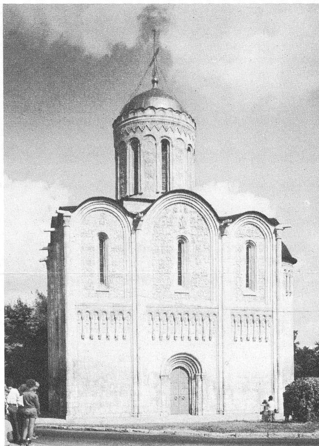
Aussenansicht der Demetrios-Kathedrale.

und Gebieten. Sie ersetzen die bisherigen lokalen Leiter, die sich entweder offen hinter die Putschisten gestellt oder sie jedenfalls nicht ausdrücklich verurteilt hatten.