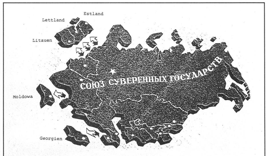
So zeichnet «Iswestija» vom 6. September die beabsichtigte «Union souveräner Staaten» (USS) mit den einstweilen sicheren fünf Abgängen.