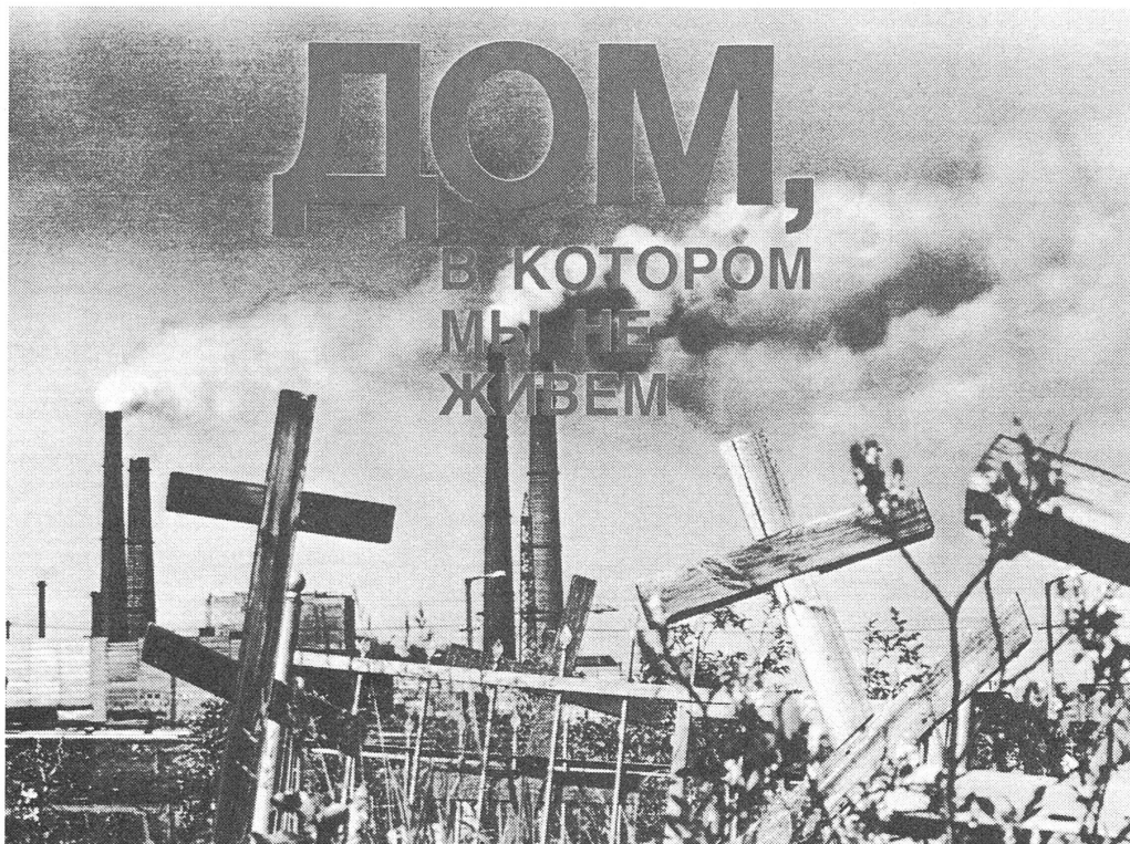
«Ein Haus, in welchem wir nicht wohnen.» («Ogonjok», Moskau, Nr. 33/1991).

zupressen, misslang. Die neue Qualität passte nicht zum verfaulten Haus . . . Als nach 1987 die Frage der neuen, alternativen Wahlen aktuell wurde, versetzte das die Partei- und Staatselite in Schrecken: «Wieso, wozu, es kommen zufällige Leute, und die alten, bewährten Kader gehen weg . . .» Damals konnte oder wollte der Generalsekretär den Widerstand der Parteiapparatspitze nicht überwinden . . .