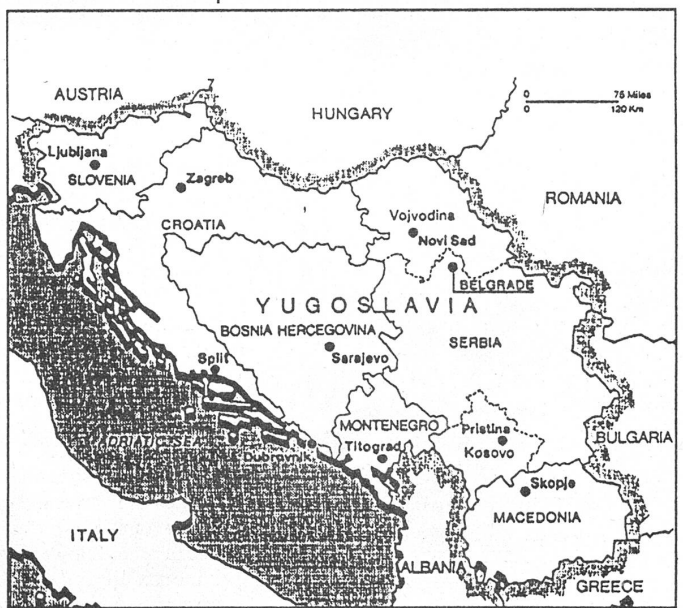
Der Anspruch auf ein grosses Serbien aller Serben in einer Karte von «Glas Srba» (links). Dazu die Inschrift «Serben, denkt daran: Das ist euer serbisches Land!» Rechts zum Vergleich eine Karte mit den gegenwärtigen Grenzen der jugoslawischen Republiken.