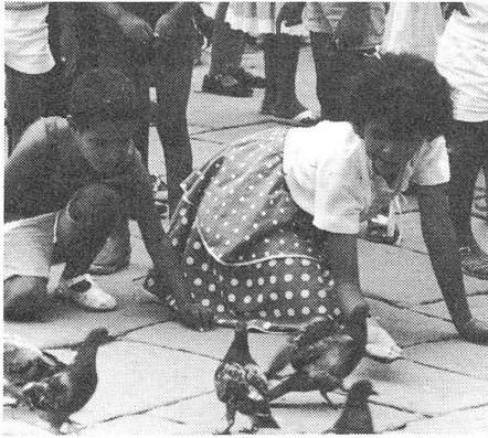
Die Tauben sind in Jerusalem schon da . . .

Gemäss Khaled Hassan, eines Begründers der El-Fatah, rieten die Sowjets Nasser, den von arabischen Staaten unabhängigen extremistischen palästinensischen Nationalismus zu brechen. Der 1964 gegründeten PLO wurde keine Bedeutung beigemessen. Palästinensische Angriffe in Israel wurden von den sowjetischen Medien totgeschwiegen.