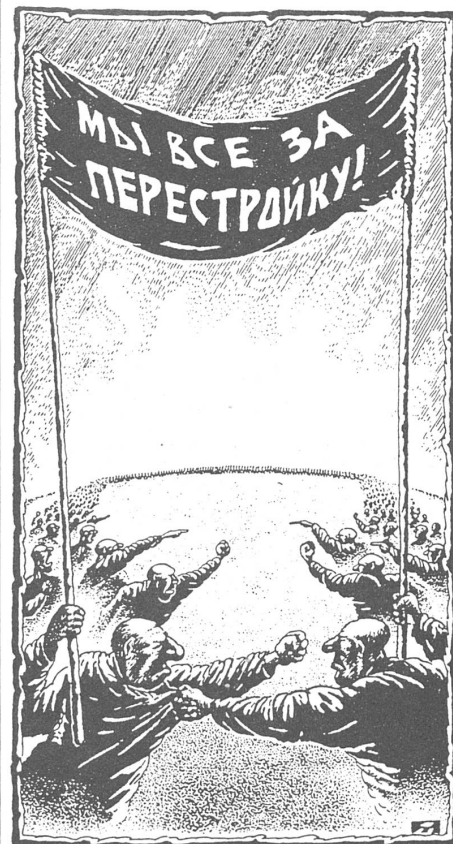
Wir sind alle für die Perestrojka. («Ogonjok», Moskau, Nr. 1/1991)

Die Systembewahrer sind aus Prinzip gegen die Privatisierung, aber das hindert sie in keiner Weise daran, als privilegierte Personen illegalen Profit daraus zu ziehen. Eine Untersuchungskommission des Obersten Sowjets der UdSSR hat über die häufigsten Unregelmässigkeiten beim Verkauf von Staatseigentum, insbesondere von Ferienhäusern, an Private berichtet. Parteifunktionäre und höhere Militärs kommen dank ihrer Stellung zu Spottpreisen in den Besitz der ausgeschriebenen Objekte.