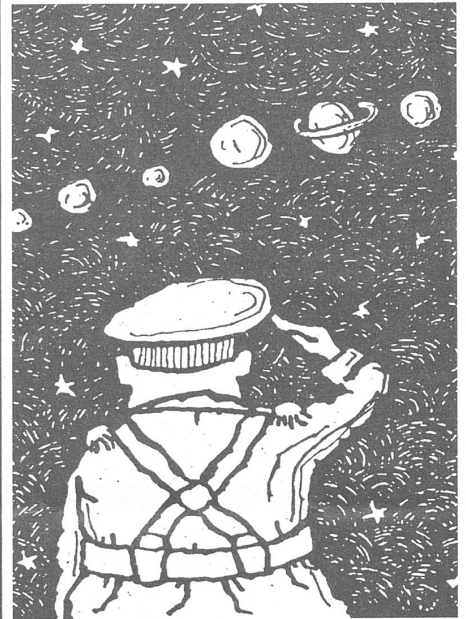
«Neue Zeit», Moskau, Nr. 9/1991.

Ein Drittel des jugoslawischen Staatsbudgets verschlingt das Verteidigungsministerium. Ein Offizier mittleren Ranges verdient monatlich umgerechnet an die 3000 Franken. Vergleichsweise dazu beträgt das jugoslawische Monatssalär im Durchschnitt etwa 550 Franken. (j. b.)