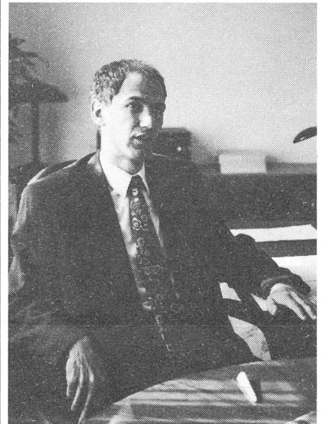
Der slowenische Aussenminister Janez Jansa