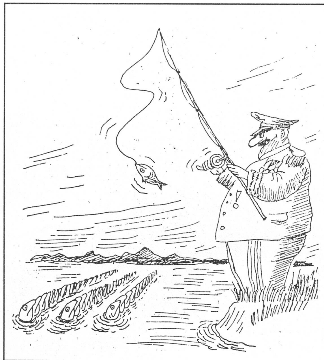
«Neue Zeit», Moskau, Nr. 11/1991

Die Zeit der Kredite «für Gorbatschow» ist vorbei. Dort, von wo die sowjetischen Leader zurückkamen, beobachtet man heute aufmerksam die verschiedensten Akteure auf der sowjetischen politischen Bühne. Eine Epoche der Kredite «für Genossen (Herrn) X» wird kaum eintreten. Konkrete Unterstützung kann man nur bei funktionierenden oder wenigstens real in Angriff genommenen Marktmechanismen erwarten. Damit haben es aber, ungeachtet der Beteuerung des Gegenteils, die regierenden parteinahen Strukturen nicht eilig, sich festzulegen. ■