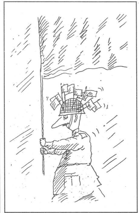
«Neue Zeit», Nr. 3/1991

Auch der immer stärker werdende Gegensatz zwischen Syrien und dem gleichfalls prosovjatischen Irak blockierte dann die Ambitionen Moskaus im Nahen Osten. Der irakische Angriffskrieg gegen Khomeinys Iran änderte nun Fronten und Interessen. Weil der Sowjetunion daran gelegen war, ein Übergreifen der islamischen Revolution auf die 50 Millionen Muslime in der UdSSR zu verhindern, gelangte sie zu einem gemeinsamen Interesse mit Washington, das von Khomeiny vorrangig malträtiert worden war. So erhielt Saddam Hussein eine gemeinsame Waffenhilfe der beiden Supermächte und ihrer Verbündeten. Dass Syrien in diesem achtjährigen Krieg auf der Seite des Iran stand, musste Moskau hinnehmen. Der Westen seinerseits liess es zu, dass Syrien im Windschatten des ersten Golfkrieges den halben Libanon okkupierte. An sich hätte die syrische Aggression die UNO ebenso mobilisieren müssen wie die spätere