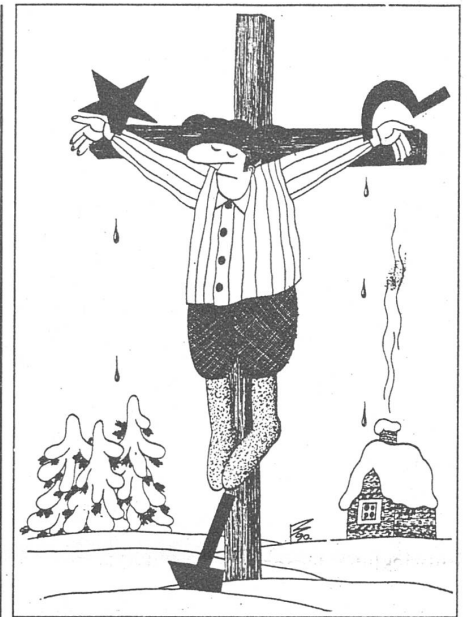
«Neue Zeit», Moskau, Nr. 16/1991

Der Pakt war so angelegt, dass jedes Land eine bestimmte Aufgabe hatte. Die Polen hatten über die Entspannung nachzudenken, Tschechoslowakei und DDR waren in der Dritten Welt tätig, Ungarn konnte mit Reformen hantieren. In den strategischen Fragen hatte aber die Sowjetunion das Sagen.