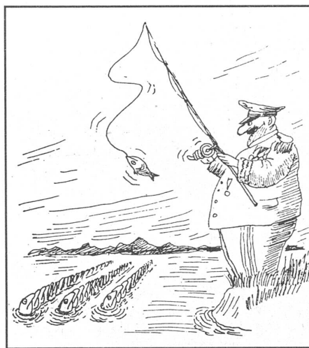
Karikaturen aus «Nowoje Wremja», Moskau.