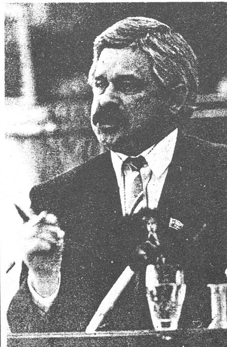
Alexander Ruzkoi, Volksdeputierter der RSFSR

lich-politischen Strömungen zusammenzuarbeiten. Inzwischen erhalte ich Briefe und Telegramme: 25 000 Menschen möchten unserer Organisation beitreten, ohne die KPdSU zu verlassen. ■