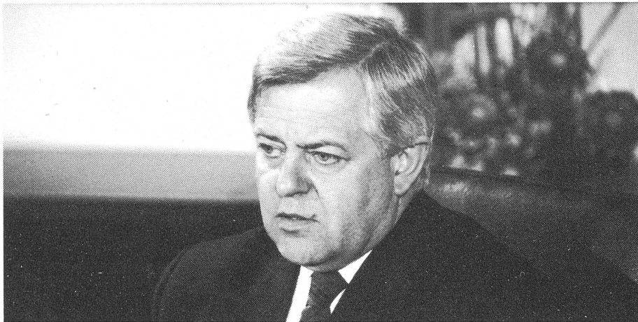
Milan Kucan.

Letztlich geht es im kommenden neuen Europa auch um das demokratische Gewissen. Heute stellt sich unsere Zivilisation in später Einsicht die Frage, wie es denn gekommen sei, dass ganze Tierarten verschwunden sind. Die Europäer sollen sich nicht in einigen Jahrzehnten die Frage stellen müssen, wieso einige kleine Nationen zum Verschwinden kamen. ■