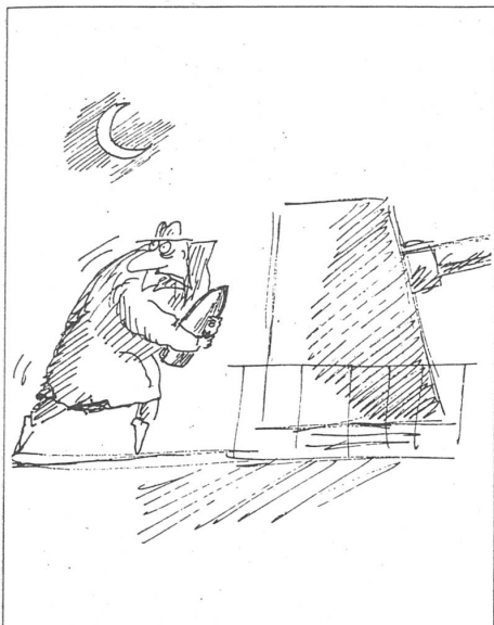
«Neue Zeit», Moskau, Nr. 2/1991.