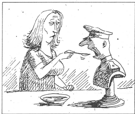
«Neue Zeit», Moskau, Nr. 2/1991.

mässige Tätigkeit als verbrecherisch erscheinen lassen?