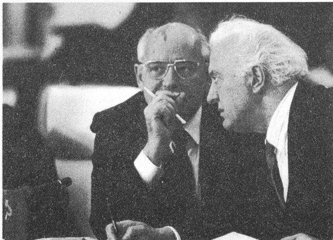
Gorbatschow und Schewardnadse – vorher

So sehe ich die Situation. Und weil ich sie so sehe, bleibt mir nur eines zu tun. Ich muss zurücktreten.