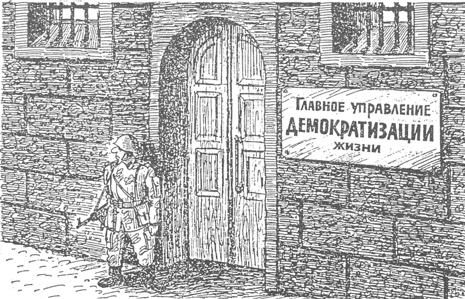
Vor der «Hauptverwaltung für Demokratisierung». («Komsomolskaja prawda», Moskau, 16. 1. 1991)