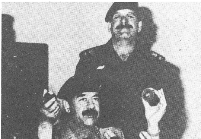
Saddam präsentiert Zünder. («Neue Zeit», Moskau)

und Tritt in terroristische Diktaturen. Ein Beispiel dafür ist der Irak unter der Führung des «arabischen Stalins», wie sich Saddam Hussein beizeiten titulierte.