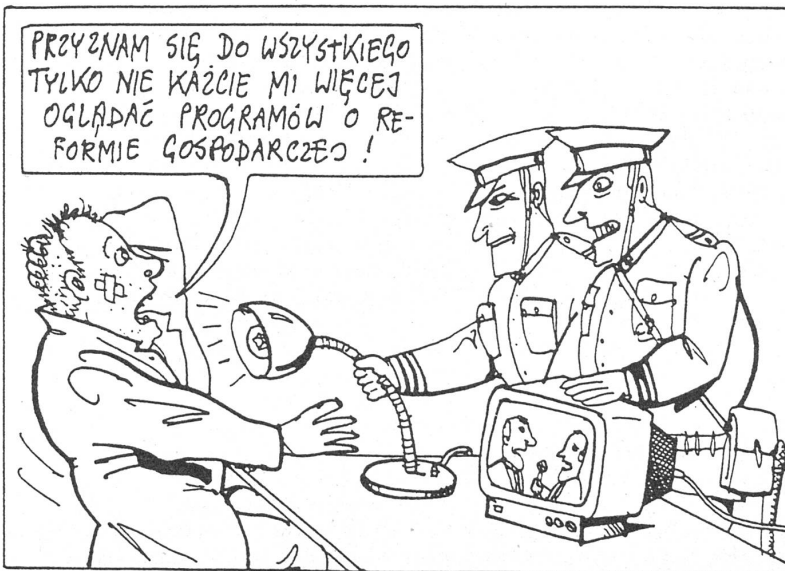
Oben: «Ich gestehe ja alles, aber zwingt mich nicht mehr, die TV-Sendungen über Wirtschaftsreformen anzuschauen.»