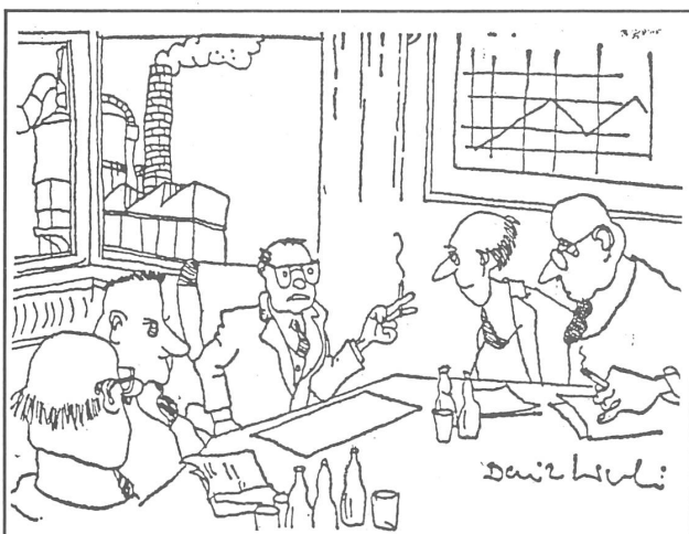
«Keine Streiks mehr in jüngster Zeit; wir haben den Leuten zu hohe Löhne bezahlt.» («Prawo i zycie», Warschau)

Jene Polen, die diesem Tyminski ihre Stimme gaben, zeigten ihre Unzufriedenheit mit der Lage in ihrem Land, und dass man