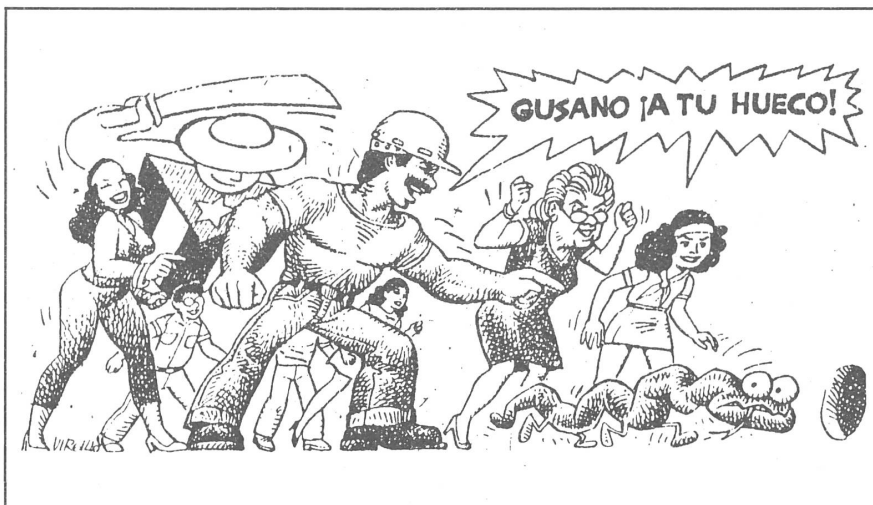
10 «Verkriech dich in dein Loch, du (regimekritischer) Wurm!» MN-Reproduktion einer «Karikatur» aus der kubanischen Zeitung «Gramma».

Mehrfach habe ich beobachtet, wie man die Reden verfolgte. Natürlich kann man in den hinteren Reihen auch Leute sehen, die ihren eigenen Gedanken nachgehen, die vor sich hinduseln oder die sich ganz leise davon schleichen. Aber in der Mehrzahl hören die Leute aufmerksam zu.