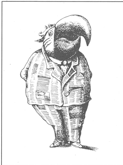
«Neue Zeit», Moskau, Nr. 43/1990.

Die Konvergenz? Auf jeden Fall scheint dieser Gedanke, erst vor kurzem als ketzerisch verschrien, es heute nicht mehr zu sein. ■