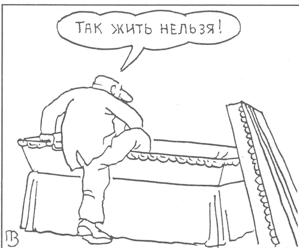
«So kann man nicht weiterleben.» («Prawda», Moskau, 18. 11. 1990)

Sprachen wir z. B. von der Notwendigkeit, die sowjetische Wirtschaft auf das Marktgeleise umzustellen, so wurde uns nachdrücklich empfohlen, nicht die soziale Ungleichheit zu mehren und uns nicht der Selbsttäuschung hinzugeben, die Marktlogik könnte die Defizite und ökonomischen Schlappen aus der Welt schaffen. Erzählten wir von neuen Tendenzen in der sowjetischen Journalistik, von ihrer Befreiung aus den bürokratischen Fesseln, insbesondere von günstigen Veränderungen der letzten Jahre in unserer «Neuen Zeit» und ihrer neuen Orientierung, so mussten wir feststellen, dass unsere Gesprächspartner die frühere Zeitschrift für sehr interessant und inhaltsvoll halten, während sie in ihr heute so gut wie nichts Lesenswertes finden. Charakterisierten wir die internationale Situation vom Standpunkt des neuen Denkens als Einstellung der weltweiten Ost-West-Konfrontation, so legte man uns ans Herz, nicht die politische Orientierung zu verlieren, weil Hauptinhalt der Weltpolitik die Organisa-