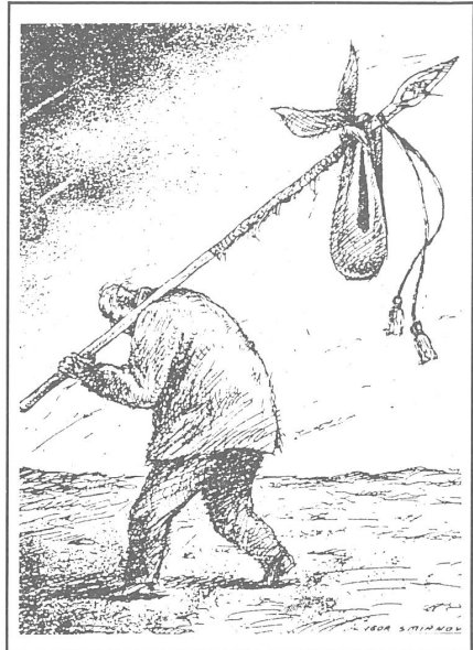
Die zum Artikel gesellte NZ-Karikatur.

Unsere Konservativen, die nicht unbedingt nur auf den oberen Stufen des bürokratischen Apparats zu suchen sind, sondern in allen Schichten der Gesellschaft existieren, sind uns mehr oder weniger klar. Die einen wollen um keinen Preis ihre distributiven Privilegien und ihren Platz an der Abfüllmaschine verlieren. Andere klammern sich an genaue, aber primitiv schmalspurige Dogmen, die für sie die Lebensmaximen schlechthin sind. Wieder andere haben ein-