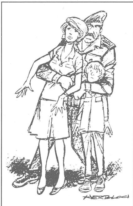
Der starke Mann Saddam Hussein. Diese «Newsweek»-Karikatur ist im zustimmenden Sinn übernommen worden von der «Neuen Zeit», Moskau, Nr. 43/1990.

Im Fall Iran hat sich Saddam Hussein in der Widerstandskraft seines Gegners verschätzt,