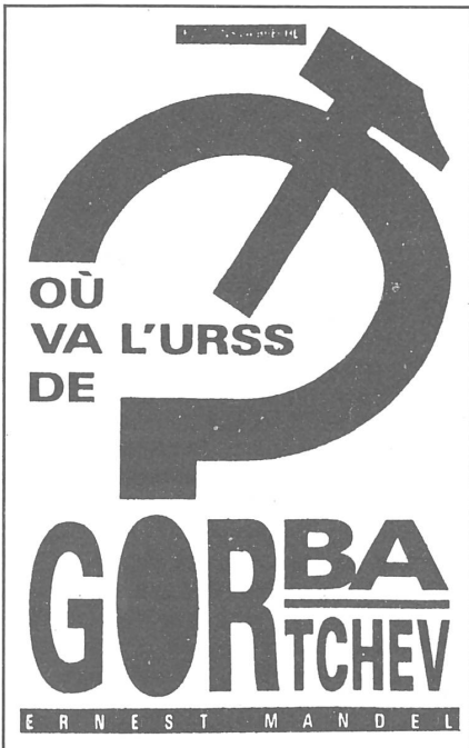
Die Titelfrage einer trotzkistischen Broschüre. Sie gilt auch unter andern Aspekten.

gen, mit der Verschiebung gewaltiger Menschenmassen nach dem Westen, mit der explosiven Verbreitung der ökologischen Katastrophe, die schon so eine existentielle Bedrohung für den gesamten Kontinent darstellt. Eine Garantie gegen diese Übel gibt es ohnehin nicht, aber das definitive Scheitern der gegenwärtigen Sowjetführung würde die Wendung zum Schlimmern fast zwangsläufig herbeiführen. Es ist denn auch nur logisch, dass praktisch die gesamte «politische Klasse» des Westens einmütig hinter Gorbatschow steht.